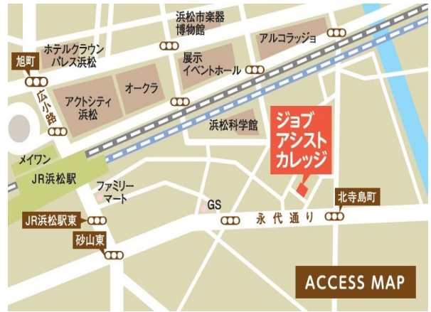
「訓練実施会場」案内図

〒435-0056 浜松市東区小池町 2444-1 ☎053-462-5602 電車：遠鉄電車「自動車学校前」駅から、徒歩約15分 車：JR浜松駅から約20分、 東名高速道路「浜松インター」から約15分